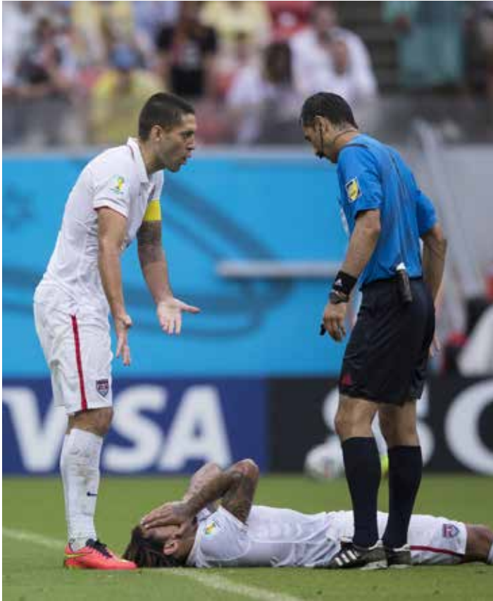
Dass Schiedsrichter und Spieler zusammenprallen, passiert selbst im internationalen Spitzen-Fußball - wie hier beim WM-Spiel Deutschland gegen die USA vor zwei Jahren.

erfahrene FIFA-Unparteiische in diesem Moment sein Stellungsspiel dem Spielgeschehen sinnvoll angepasst hatte: War die Position wenige Meter vor dem Strafraum taktisch klug? Müssen Schiedsrichter nicht bemüht sein, sich aus den kritischen Zonen des Spielfelds möglichst herauszuhalten?