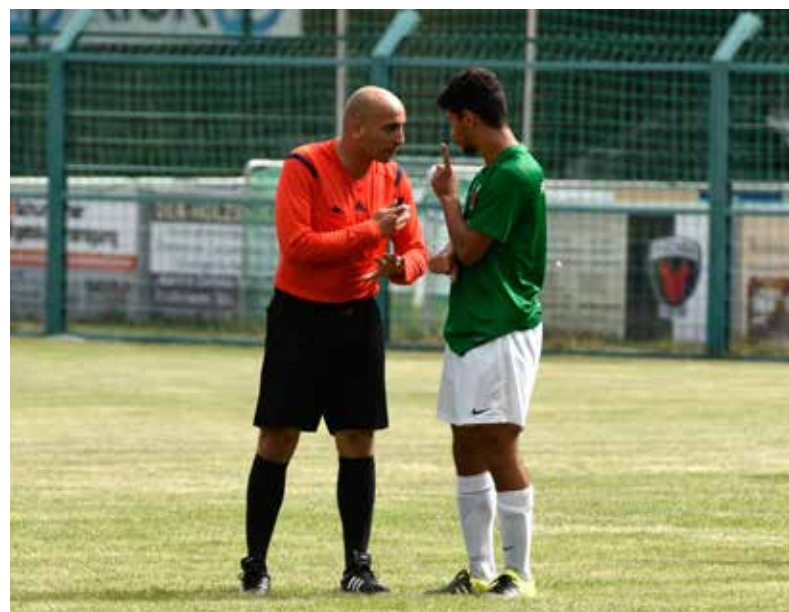
...und im Gespräch mit den Spielern wird im Zweifelsfall auf die englische Sprache zurückgegriffen.