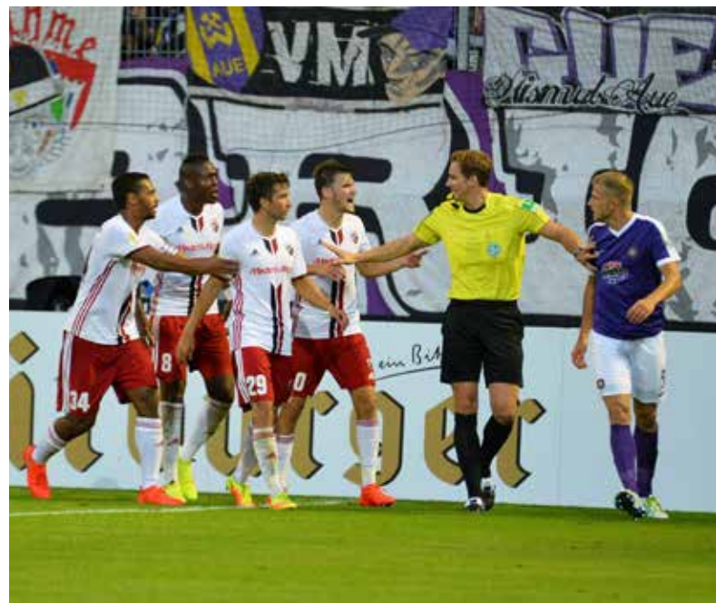
In Konflikt-Situationen ist es wichtig, dass der Unparteiische von seiner „Diagonalen“ abweicht und schnellstmöglich für Ordnung auf dem Platz sorgt.

Die meisten Unparteiischen - in den Kreisen, bei Jugendspielen und bei Spielen der Altherren - müssen ohne die Hilfe von neutralen Assistenten auskommen. Dennoch wird von ihnen erwartet, dass sie ihre Entscheidungen möglichst aus der Nahdistanz treffen. Je größer die Entfernung zum Geschehen ist, umso lauter wird die Kritik der Aktiven, Offiziellen und der Zuschauer.