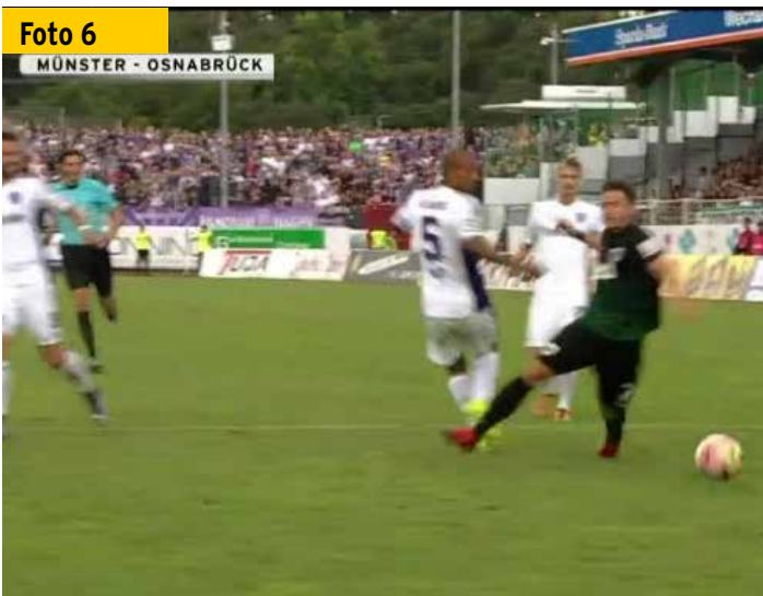
Aus seiner guten Position konnte Schiedsrichter Deniz Aytekin den Sturz des Spielers als „Schwalbe“ entlarven und bestrafen.

unmittelbar vor dem Foulspiel sehr weit nach rechts vorgelegt (nicht ganz einfach zu erkennen auf Foto 3b). Deshalb ist die Wahrscheinlichkeit für Finnbogason, auch ohne Brumas Foulspiel den Ballbesitz behaupten zu können, eher gering (Kriterium 2). Und das vor allem, weil der heranlaufende Wolfsburger Ricardo Rodriguez sehr wahrscheinlich noch hätte eingreifen können (Kriterium 3).