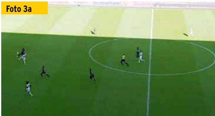
Unmittelbar nachdem der Augsburger Angreifer (weißes Trikot) den Ball mit links an seinem Gegner vorbei gespielt hat, wird er gefoult.

verdanken oder den sie lenken – den Trainern, die glauben, eine kleine Lücke oder eine Grauzone im Regelwerk erkannt zu haben, die sie zu ihrem Vorteil nutzen können. Meist läuft es aber darauf hinaus, dass der Spieler oder Trainer die Fußball-Regeln im Detail nicht so recht kennt.