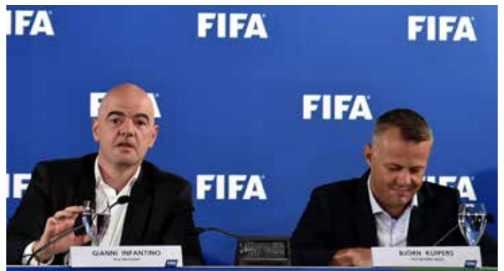
FIFA-Präsident Gianni Infantino (links) und der niederländische Referee Björn Kuipers bilanzieren den Einsatz des Video-Schiedsrichter-Assistenten.

FIFA-Präsident Gianni Infantino zeigte sich zufrieden mit dem Ausgang des ersten noch eingeschränkten Live-Experiments: „Mit Video-Schiedsrichter-Assistenten helfen wir den Schiedsrichtern und schützen das Spiel. Damit haben wir ein neues Kapitel in der Fußballgeschichte aufgeschlagen.“ Die Technik müsse dabei auf eine Weise genutzt werden, die keine negativen Auswirkungen auf den