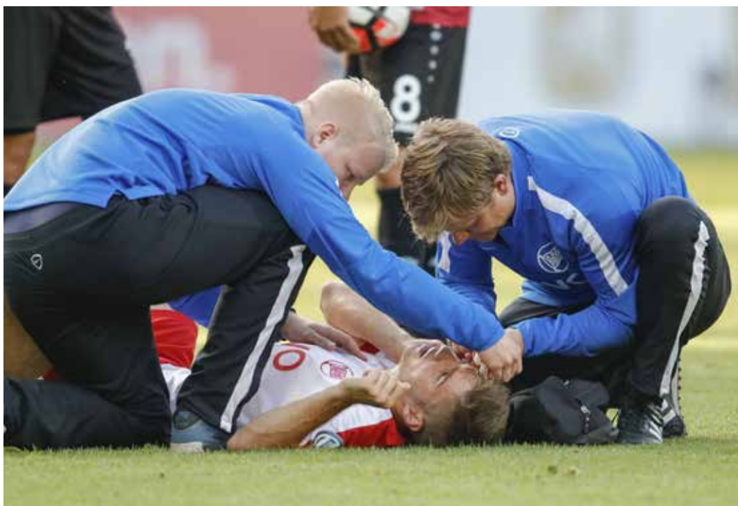
Die Schwere einer Kopfverletzung erkennt man manchmal erst auf den zweiten Blick.