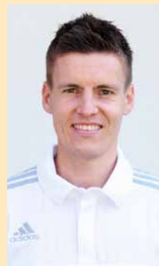
FIFA-Schiedsrichter Daniel Siebert aus Berlin.

Wie muss ich dagegen mein Laufverhalten umstellen, wenn ich während des Spiels wiederholt angeschossen werde oder im Weg stehe?