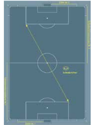
Im offiziellen Regelheft wird das Prinzip der „Diagonalen“ veranschaulicht.

Außerdem hat er dabei das Spiel zugleich zwischen sich und dem gegenüber stehenden Assistenten, der sich stets auf Höhe des vorletzten Abwehrspielers befinden soll. So finden Schiedsrichter und Assistent auch während des laufenden Spiels schnell Blickkontakt zueinander und können miteinander kommunizieren.