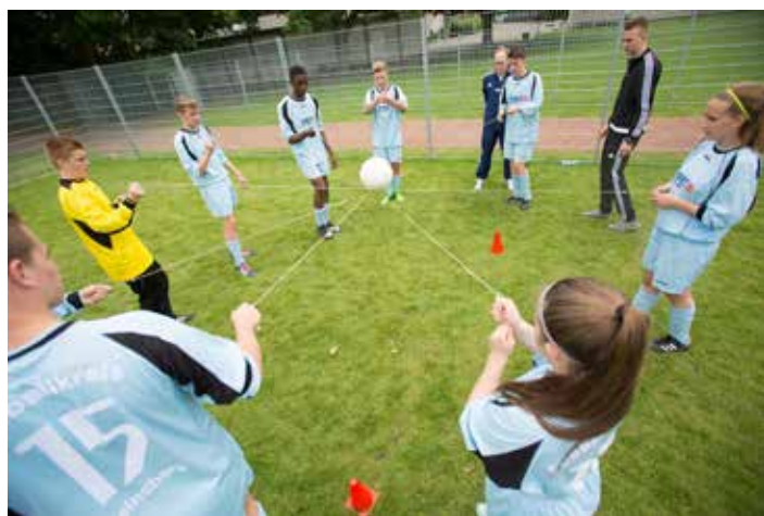
Beim ersten FVM-Jung-Schiedsrichter-Tag war nicht nur sportliche Leistung gefragt, sondern auch Teamgeist und Geschicklichkeit.