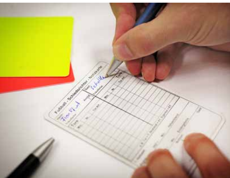
Trotz High-Tech: Die Spielnotizkarte wird auch in der Bundesliga immer noch von Hand beschriftet.