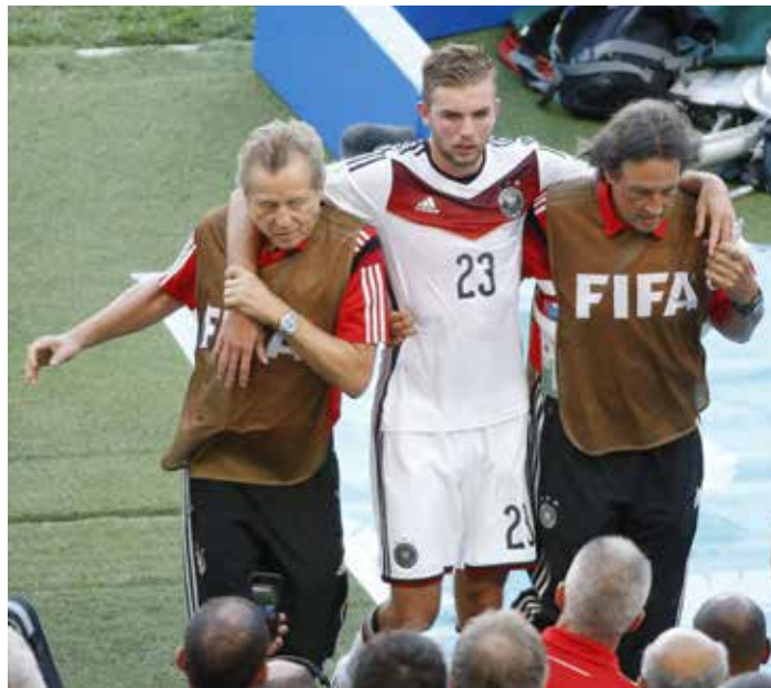
Deutschlands Christoph Kramer erlitt im WM-Finale 2014 eine Gehirnerschütterung.

nach den neuen Regeln eine kurze Behandlung auf dem Feld zulässig, ohne dass der Spieler runter muss).