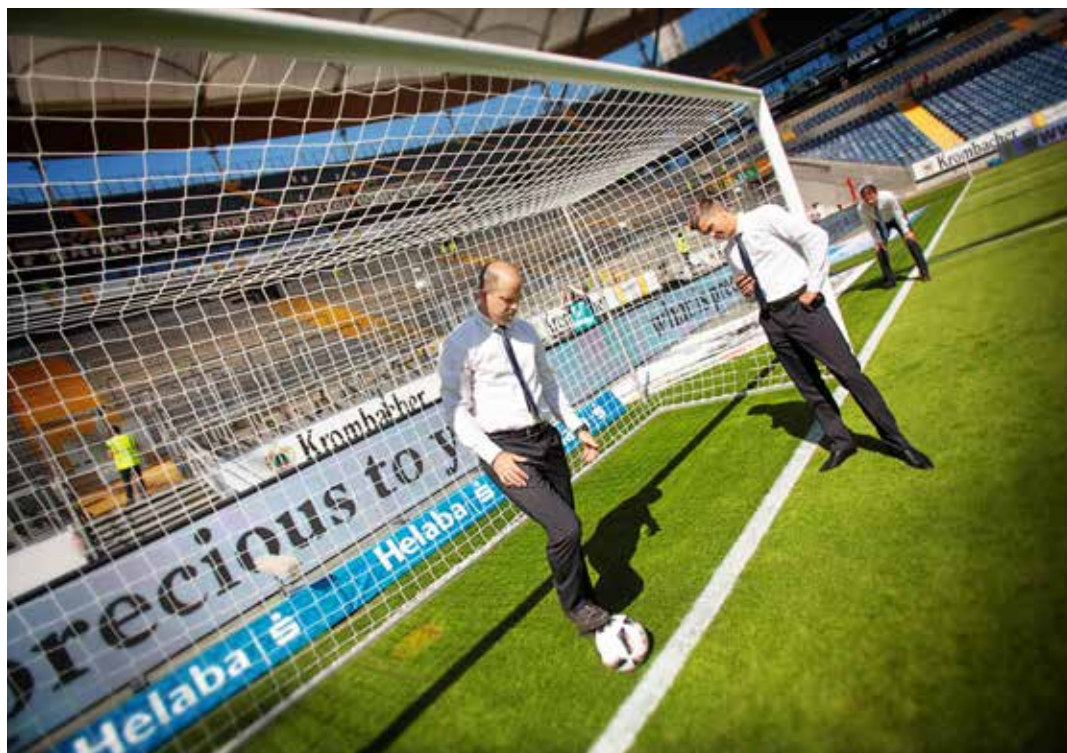
Vor dem Spiel prüft das Team, ob die Torlinien-Technik funktioniert.

Der Schiedsrichter-Beobachter der Partie zwischen Frankfurt und Schalke konnte auf solche Hilfsmittel zu seiner aktiven Zeit dagegen