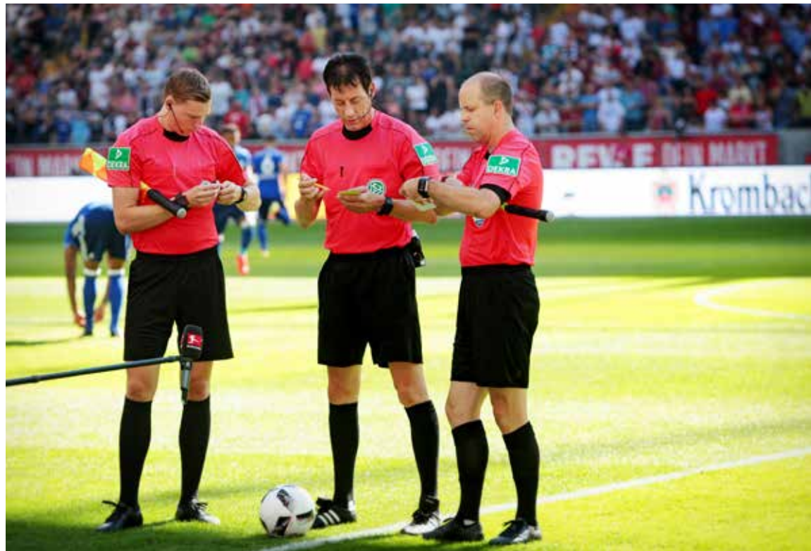
Gleich geht's los: Das Schiedsrichter-Team um Wolfgang Stark ist bereit.