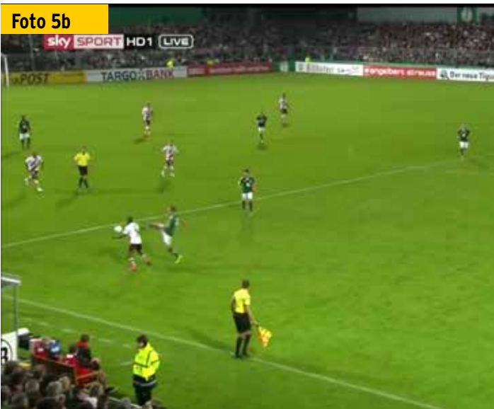
Der Schiedsrichter und sein Assistent hatten für die richtige Einschätzung eigentlich ein perfektes Stellungsspiel.