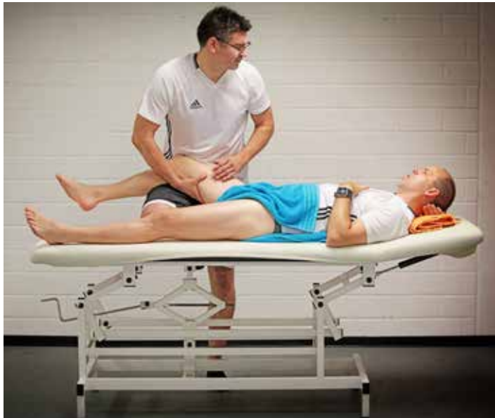
In den Katakomben der Commerzbank-Arena wird vor dem Anpfiff noch die Muskulatur gelockert.