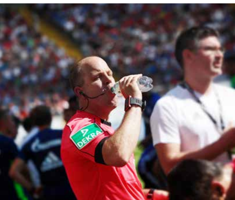
Trinkpause für die Mannschaften und das Schiedsrichter-Team bei Temperaturen über 40 Grad.

Vielleicht ist seine auch gleichzeitig die einzige Methode, einen Job zu machen, in dem jedes Wochenende Entscheidungen richtig getroffen werden, die eigentlich außerhalb dessen liegen, was das menschliche Auge wahrnehmen kann: Vorbereitung, Konzentration – und Akribie.