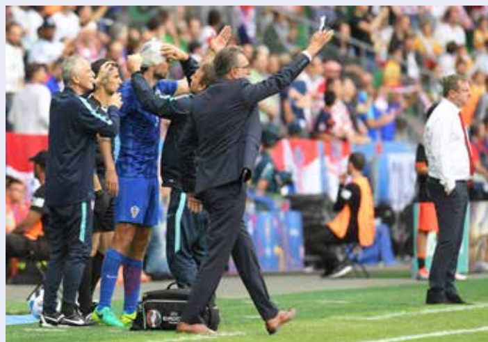
Das Problem: Oft wollen Spieler sofort wieder auf's Feld zurück - selbst wenn sie schwerer verletzt sind.

Ist kein Mannschaftsarzt aufgeführt oder anwesend, sollte der Schiedsrichter unbedingt einen Mannschaftsverantwortlichen - aus den oben aufgeführten Gründen - in seine Entscheidung miteinbinden und bei seiner Beurteilung auf Warnsignale achten.